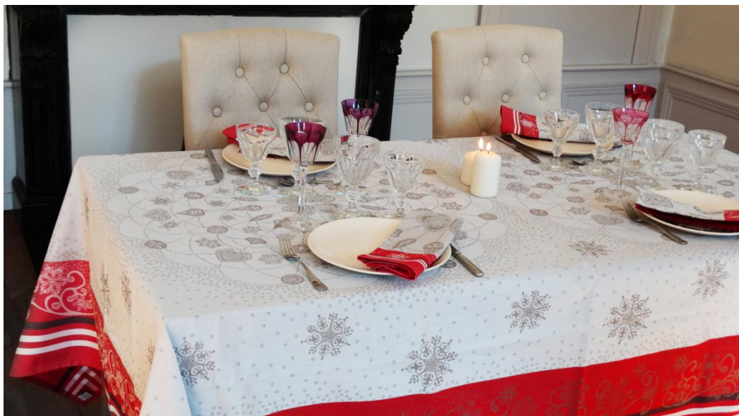
Nappe et serviettes de la collection « Snowflakes » Garnier-Thiébaud

Le verre, le cristal, la faïence ou encore le textile... Dans les mains des artisans lorrains naissent depuis des siècles des merveilles de tradition au design élégant. L'idéal pour dresser une magnifique table de fête !