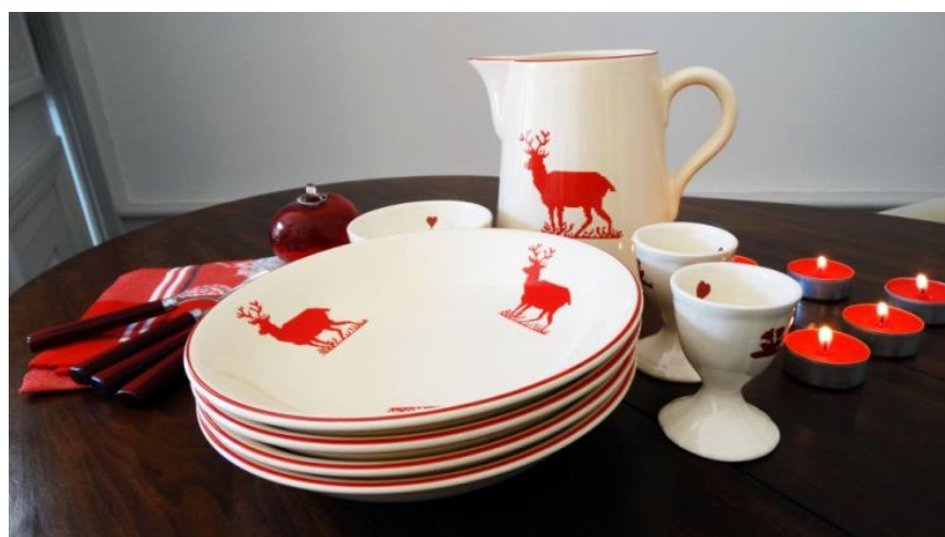
Collection « Montagne » et « Montée à l'Alpage » (ancienne collection) Faïenceries de Lunéville