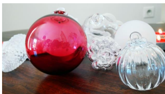
Boules de Noël en verre de Meisenthal