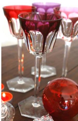
Verres « Harcourt » Baccarat