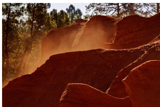
Ocres et mistral au sentier des ocres à Roussillon