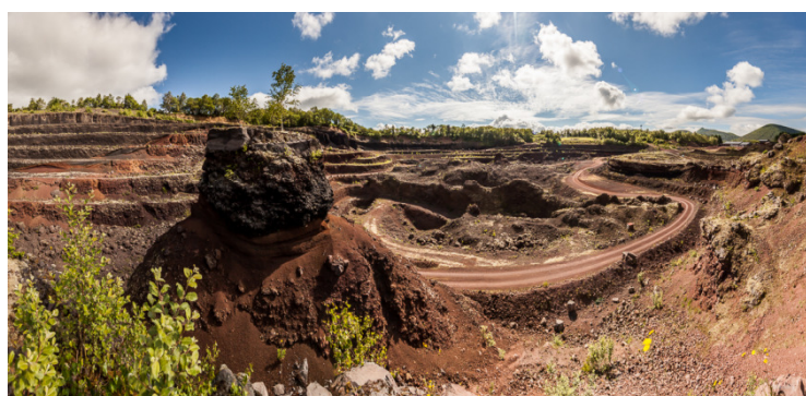
Combrailles – Le volcan de Lemptégy

Alliées à un maillage du territoire par les artisans-créateurs et restaurateurs, ainsi que par un réseau fort de plusieurs Festivals et saisons culturelles, les Combrailles sont un creuset pour une offre culturelle ancrée.