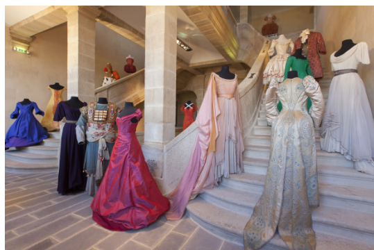
Centre national du costume de scène