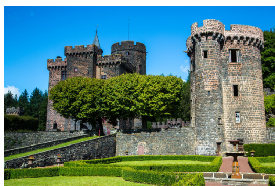
Combrailles – Château Dauphin